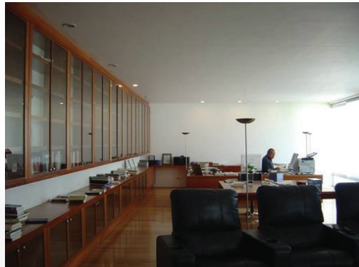
PROYECTO EN COLABORACION, SAN MIGUEL CHAPULTEPEC CDMX 2006