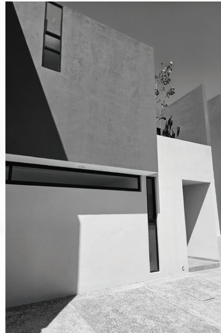
CAPITAL SUR / QRO. 2023