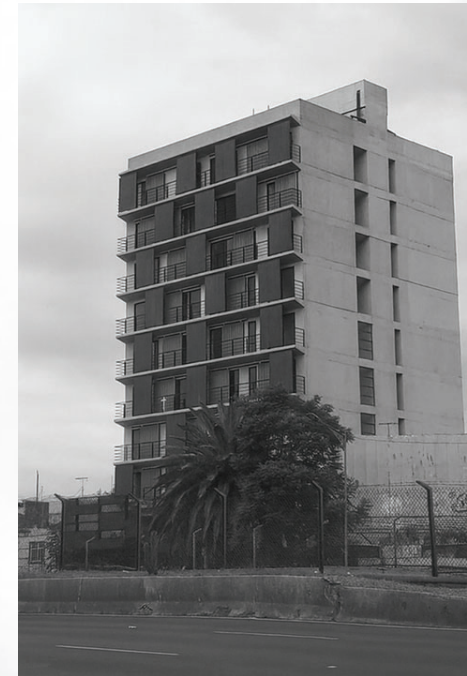
XOLA / CDMX 2019