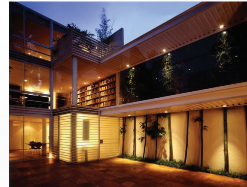
PROYECTO EN COLABORACION, ALTAVISTA CDMX 2004