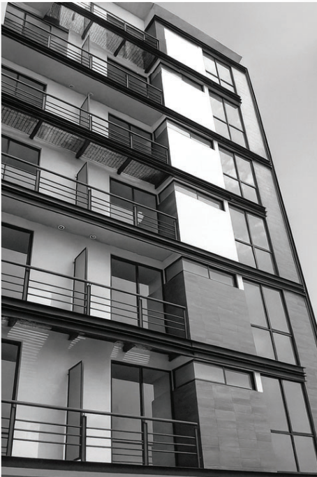
V. CARRANZA / CDMX 2018