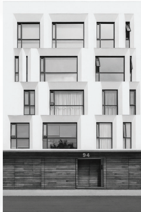
COYOACAN / CDMX 2020